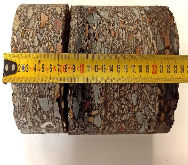
Jádrový vývrt č. 2